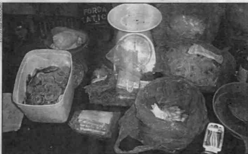
Além de crack, maconha e coca, foram apreendidos munições, dinheiro, anotações e embalagens

las contendo cocaína, além de R$ 160,00 em dinheiro.