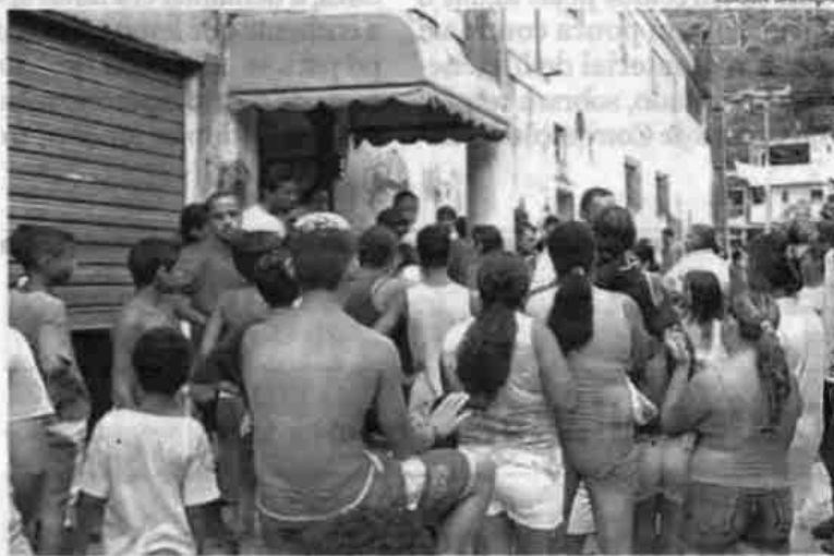
Familiares e amigos da paciente fizeram passeata pedindo vacina