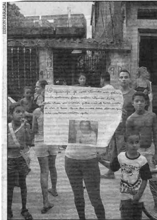
Familiares e amigos da adolescente fizeram passeata por vacinas