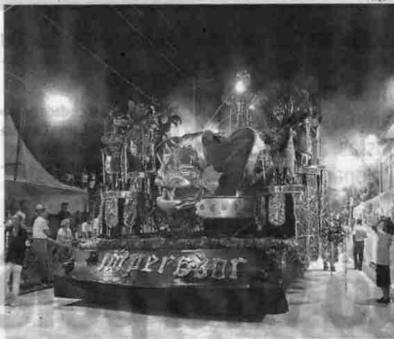
última escola deve entrar na avenida às 2 horas da madrugada

A corte carnavalesca abre o desfile do grupo especial das escolas do Município, que têm ainda Grêmio Recreativo Escola de Samba Renascer do Boré de Santa Cruz dos Navegantes, às 23 horas, a Sociedade Recreativa e Cultural do Samba Imperador da Ilha de Santo Amaro (meia-noite), Grêmio Recreativo Escola de Samba Meninos de Elite (1 hora da madrugada) e Grêmio Recreativo Escola de Samba Mocidade São Miguel (2 horas), atual campeã do grupo especial, que