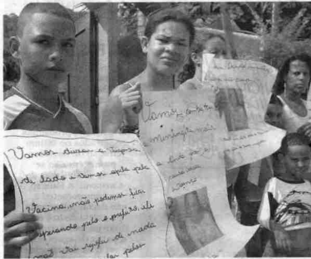
Vizinhos da jovem exibiam faixas pedindo doses da vacina para evitar mais mortes

Ela estava internada na UTI do Hospital Santo Amaro, desde a manhã de quinta-feira