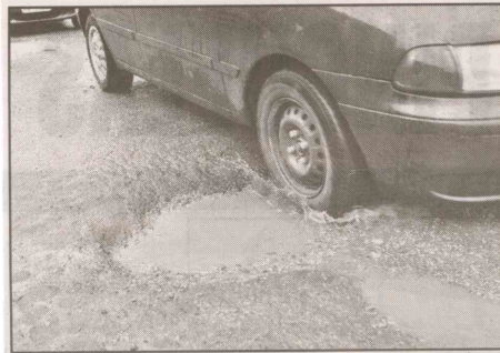
Carros precisam parar por causa das crateras: risco de prejuízos