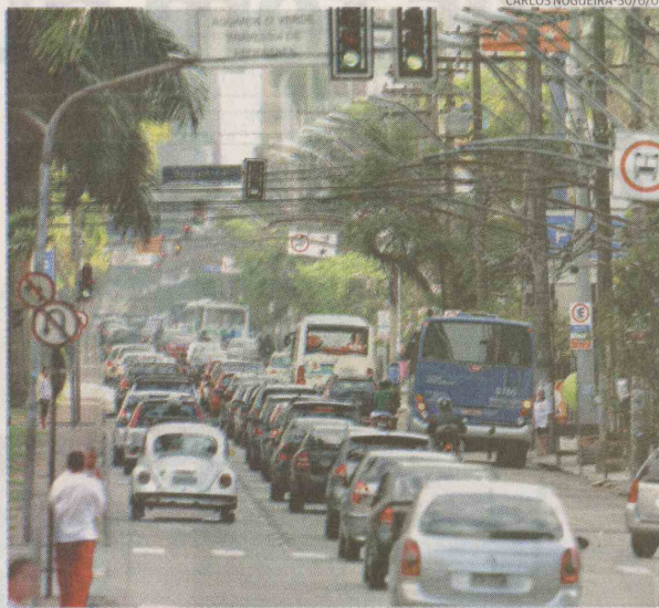
Projeto sobre Dia Mundial Sem Carro é discutido hoje em Santos

Já em Itanhaém, o motivo da discussão é o transporte