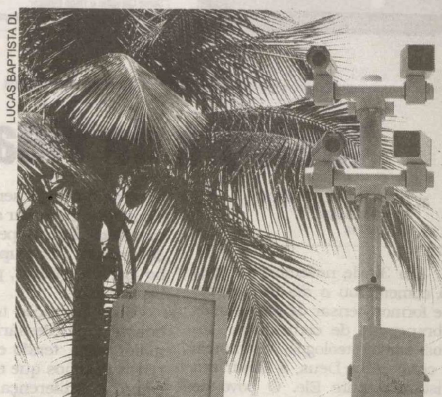
Depois de quase dois anos inoperantes, radares de Guarujá começarão a ser religados ainda este ano

Por outro lado, atendendo ao pedido do comércio local, serão expedidas licenças especiais aos veículos que fazem entregas nas localidades. "Parece uma forma precária, mas será feita a análise de cada caso, pois o equipamento é acionado quando um veículo acima do peso passa por ele", disse. "E não podemos impedir que os caminhões de entre-