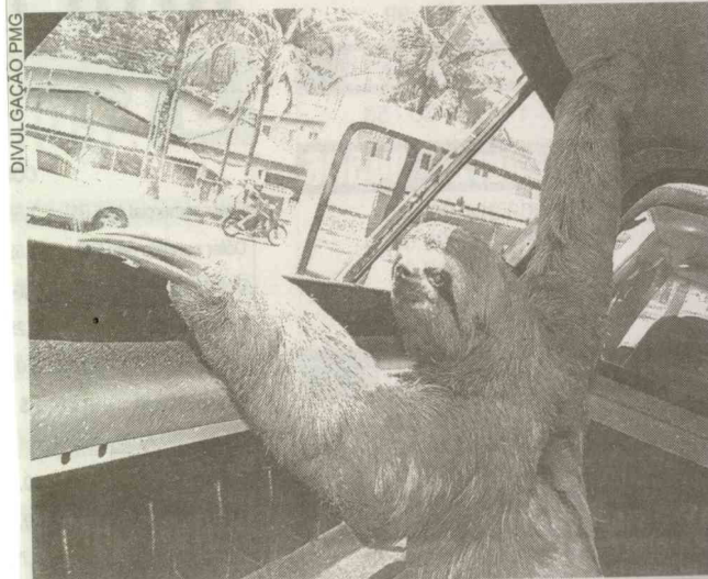
Animal foi salvo por morador e entregue à Polícia Ambiental

Segundo o sargento, aparecimento de qualquer animal silvestre em zona urbana deve ser notificado à Polícia Ambiental ou ao Corpo de Bombeiros. "Recebemos denúncias e avisos pelo 193 (Bombeiros) e 3358-4669 (Polícia Ambiental). Todos os animais resgatados são encaminhados para locais longe da área urbana, para que não prejudique a vida deles", finalizou.