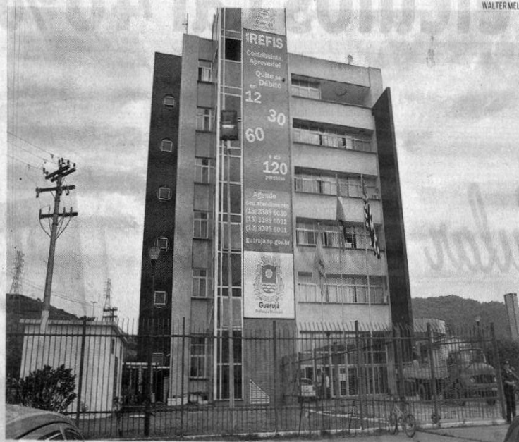
A Prefeitura decidiu suspender o concurso para advogado em razão das dúvidas que foram levantadas

A Justiça ainda determinou a anulação do concurso para advogado, que já não aconteceu no ano passado em razão de liminar. Posteriormente, a Prefeitura oficializou o cancelamento deste certame.