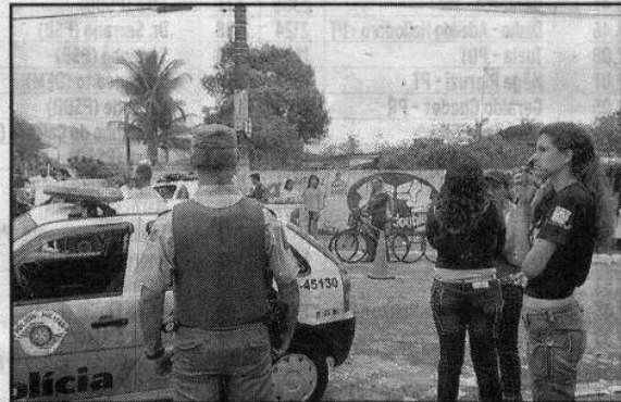
Em Praia Grande, o único jeito de fugir dos policiais era disfarçar