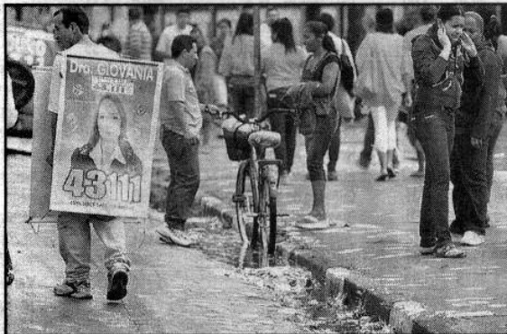
Em frente à Escola 1º de Maio, cabo eleitoral circula livremente