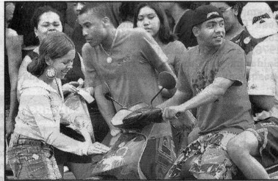
Na mesma Cidade, moto de eleitor recebe um enfeite inusitado