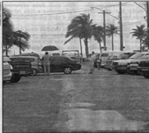
O crime aconteceu na Avenida Almirante Tamandaré sua direção para tirar satisfações.