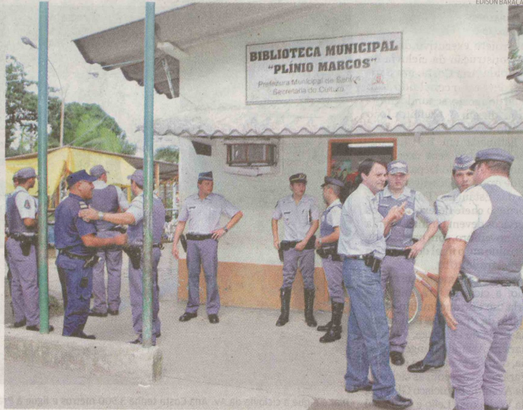
O atendimento provisório da Polícia Militar será feito na sede da Administração Regional

Até ontem, o policiamento era feito apenas pela Guarda Municipal (GM). Num primeiro momento, serão 4 PMs e um sargento, com o apoio de uma viatura, que vão fazer o patrulhamento. A ideia é construir uma base definitiva, com uma Unidade Básica de Saúde agre-