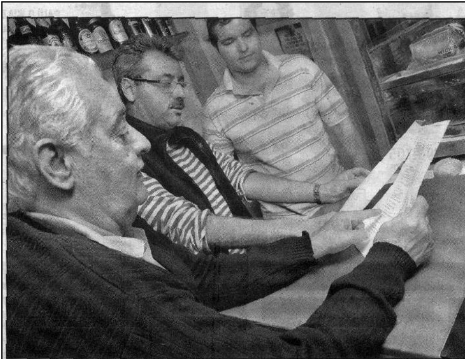
Resultado da eleição em Guarujá foi alvo de muita conversa de bar entre os eleitores