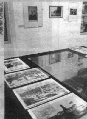
Casa Martim Afonso, em SV, conta com exposição dos quadros de Benedito Calixto