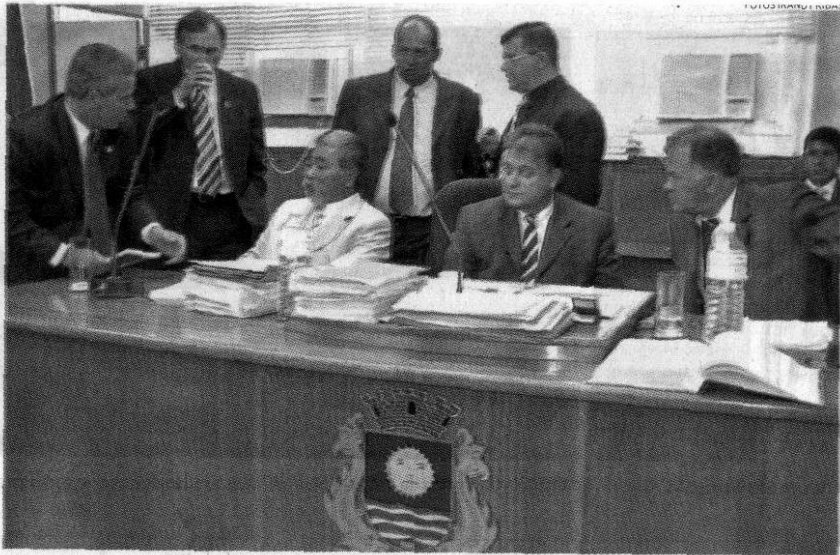
A Câmara de Guarujá terá uma renovação de quase a metade dos representantes na próxima legislatura