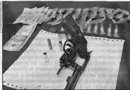
A PM encontrou com o acusado drogas, dinheiro e uma arma

Para repelir a agressão, um dos policiais atirou três vezes contra o marginal, que foi atingido na região do tórax. Em seguida,