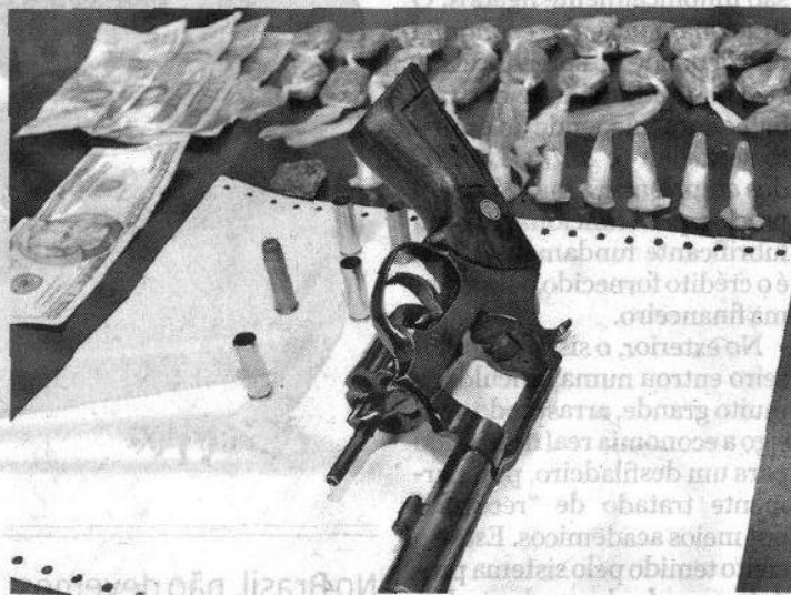
Arma de fogo, drogas e dinheiro foram apreendidos com o acusado