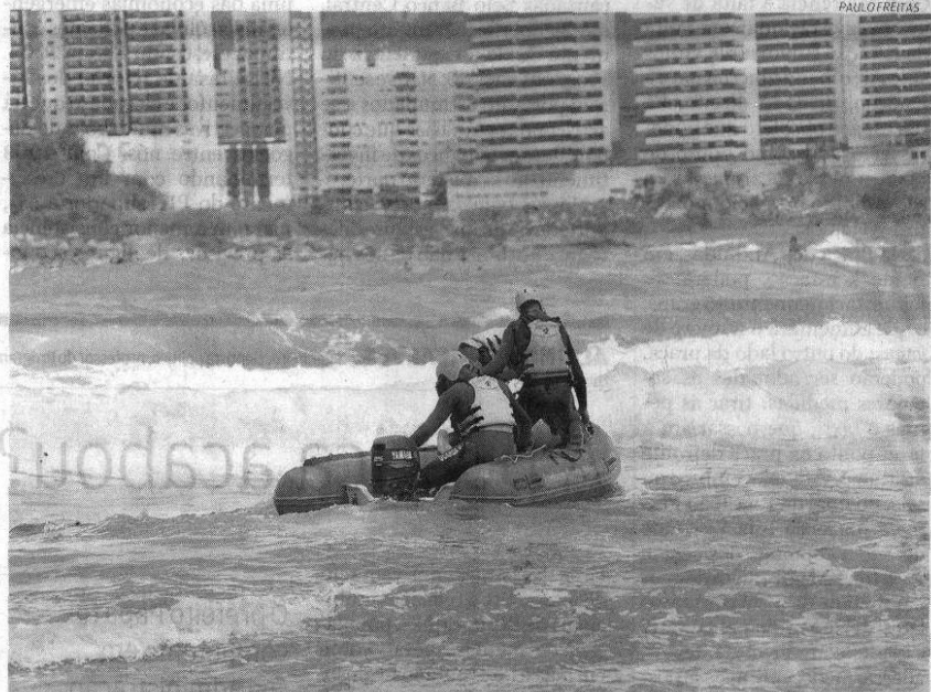
O mar agitado dificultou os trabalhos de buscas realizados por equipes do 17º Grupamento de Bombeiros

De acordo com o Corpo de Bombeiros, o desaparecimento ocorreu a cerca de 30 metros do local onde, em meados de setembro, o surfista Tony Villela se afogou após salvar quatro jovens.