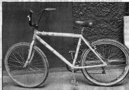
Bicicleta apreendida tinha desenhos lembrando folha da maconha

o local ficou em silêncio e os PMs entraram no beco e o encontraram ferido, caído no chão, ainda com vida. "Ele foi socorrido, mas não resistiu aos ferimentos e morreu no Posto de Atendimento Médico da Rodoviária".