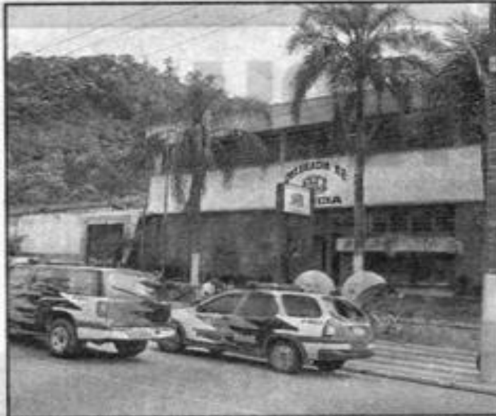
Anexa à Delegacia-sede, a unidade já foi interditada