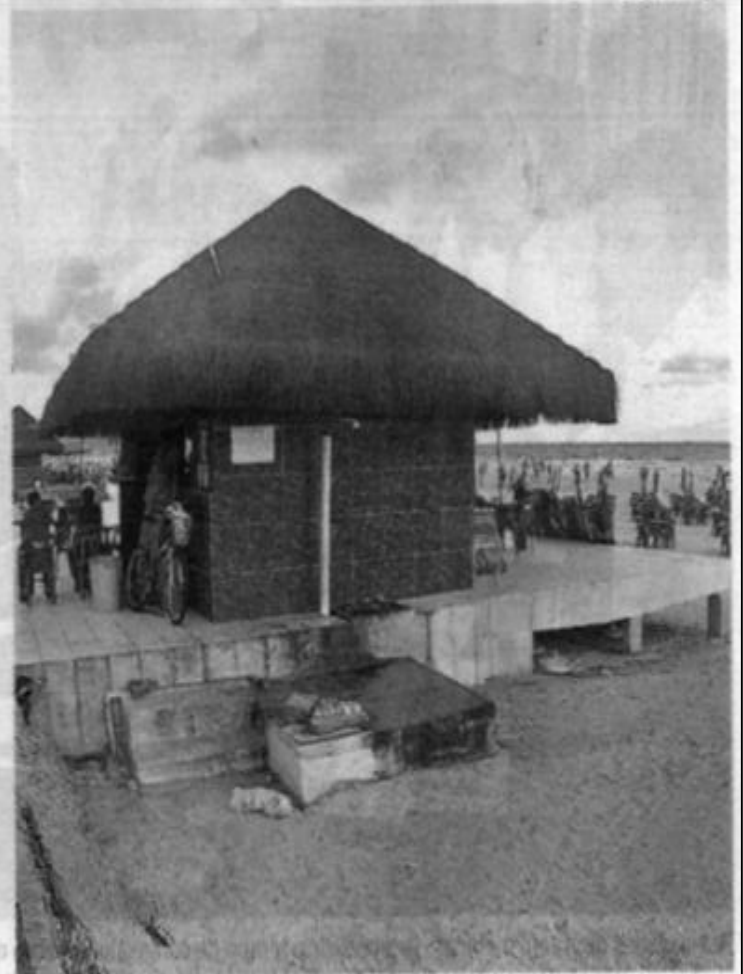
O uso da areia por estabelecimento comercial tem recebido críticas