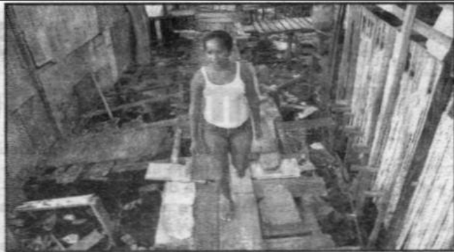
Objetivo do projeto é acabar com as palafitas e dar título de posse