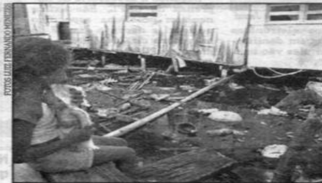
Na Rua G, o esgoto a céu aberto serve de playground às crianças

"Estamos esperando por mudanças. Aqui não tem água, luz, nada dis-