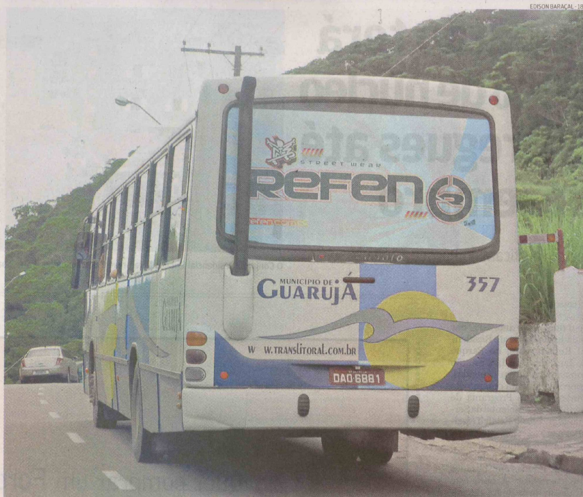
A partir do dia 30 a empresa Translitoral terá de passar a informar aos usuários o horário de passagem dos ônibus de cada linha