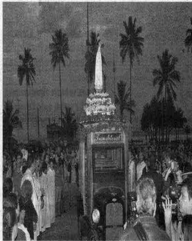
Centenas de católicos recepcionaram a imagem da padroeira

Hoje, os devotos participam da procissão, que sairá às 17h30, da Capela Nossa Senhora de Fátima com destino à Paróquia Nossa Senhora das