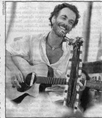
O cantor e compositor Nando Reis faz show na faixa no Guarujá

Ingressos custam de R$1,00 a R$4,00. Fica na Rua Conselheiro Ribas, 136, Aparecida, tel. 3278-9800.