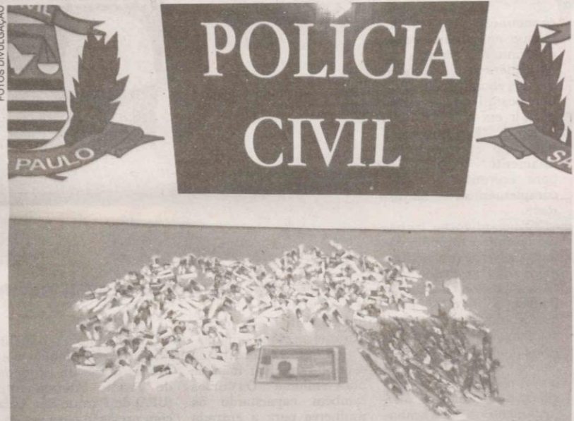
Todos os entorpecentes, na casa do acusado, estavam dentro de saco plástico escondido em cesto de roupas

268 capsulas de cocaína, com adesivos exibindo a imagem do cantor Zeca Pagodinho, foram apreendidas, bem como 34 porções de maconha