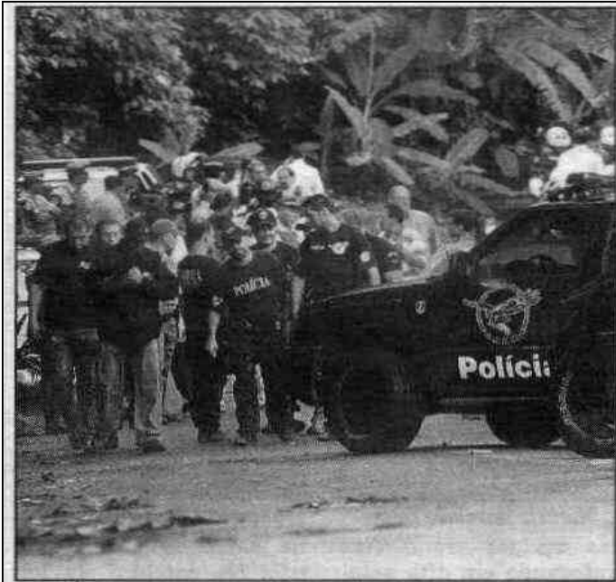
O crime ocorreu na estrada de serviço da Via Anchieta, Cubatão