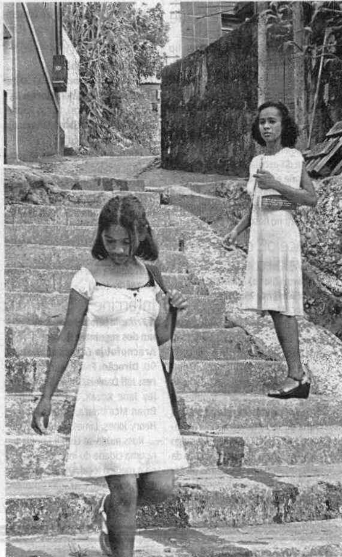
O filme mostra que o problema está presente na Baixada Santista