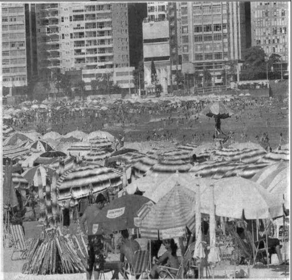
Alguns ambulantes e condomínios costumam instalar guarda-sóis e cadeiras para demarcar terreno na orla

Dessa forma, na mesma sentença, a juíza determinou o encaminhamento dos autos à Justiça estadual. Assim que o processo for distribuído numa das Varas da comarca de Guarujá, Prefeitura, os 27 condomínios e a associação acusados