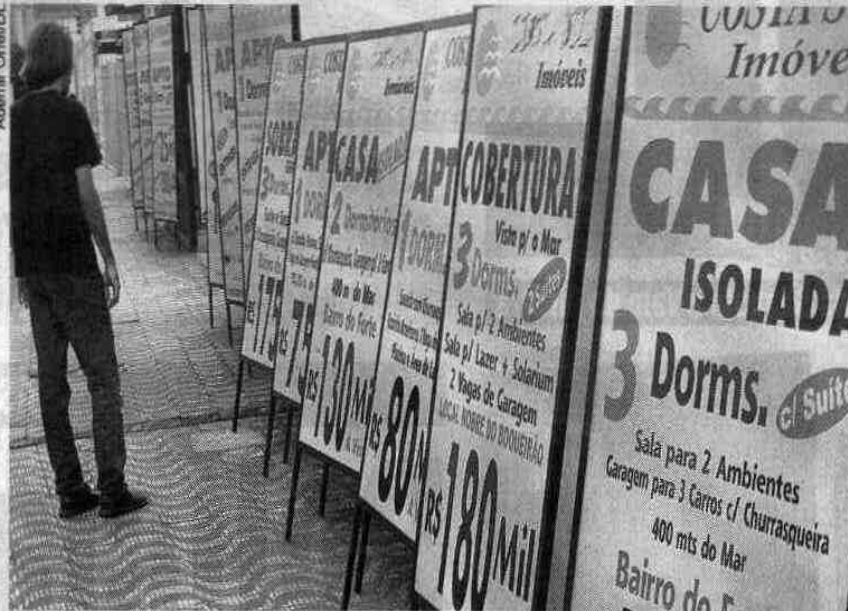
Temperaturas baixas do outono podem ser um bom negócio para os turistas no feriado

Pesquisa realizada pelo Conselho Regional de Corretores de Imóveis do Estado de São Paulo (Creci-SP) com 56 imobiliárias de 12 cidades litorâneas apurou que o menor valor diário que se encontra para esse feriado é o do aluguel de um quitinete em cidades do Litoral Sul, como Praia Grande e Peruibe. A cotação média da diária é