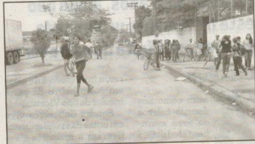
RUA SANTA ISABEL E RUA JOANA DE MENEZES FARO - EE WALTER SCHEPPIS (MONTEIRO DA CRUZ)

Não há faixa para pedestres, apenas lombada e placa. Todos os dias, a via recebe grande movimento de estudantes.