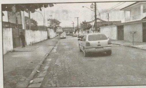
PRAÇA SOROCABA - ESCOLA MUNICIPAL ANGELINA DAIGE (VILA ÁUREA)

Não há sinalização no local, onde o tráfego de caminhões é intenso todos os dias.