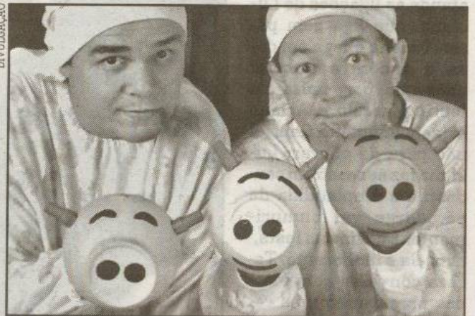
Da Cia. Circo de Bonecos, a peça estará no Procópio Ferreira