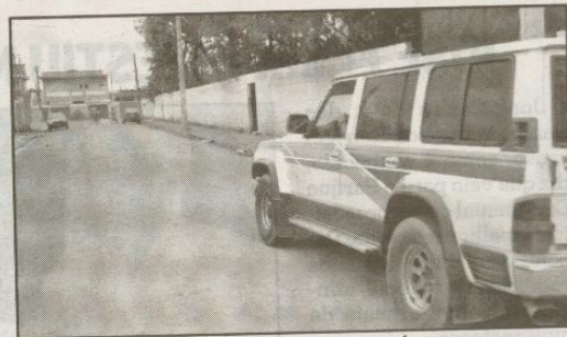
RUA LINS - EE DINIZ MARTINS (VILA ÁUREA)

Apesar da existência da escola, o local não conta com nenhuma sinalização viária.