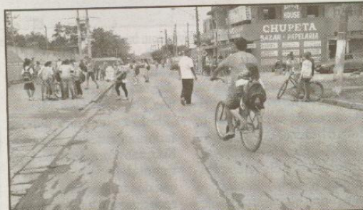
RUA ROMUALDO DOS SANTOS - ESCOLA MUNICIPAL 1º DE MAIO (J. BOA ESPERANÇA)

Não há placas, lombadas e faixa de pedestre para os estudantes nessas duas vias.