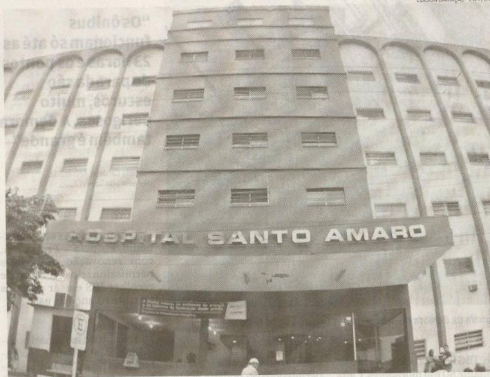
Hospital Santo Amaro é o único de Guarujá a atender pelo SUS e acumula dívida estimada em R$ 60 milhões