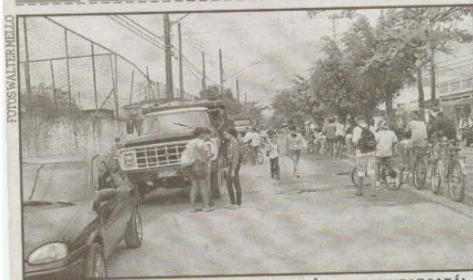
AV. SILVIO FERNANDES LOPES - EE PROF. JOSÉ CAVARIANI (PAE CARÁ)

Não há faixa para pedestres, apenas lombada e placa. Todos os dias, a via recebe grande movimento de estudantes.