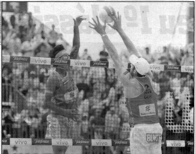
Os brasileiros venceram Brink e Dieckmann por 2 sets a 1, com parciais de 24/26, 21/19 e 15/13