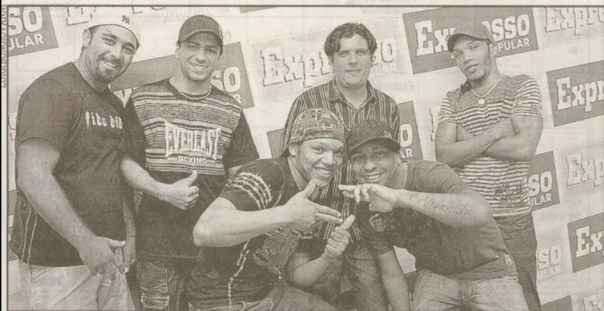
Os sambistas se preparam para gravar CD e têm a agenda de shows bem cheia