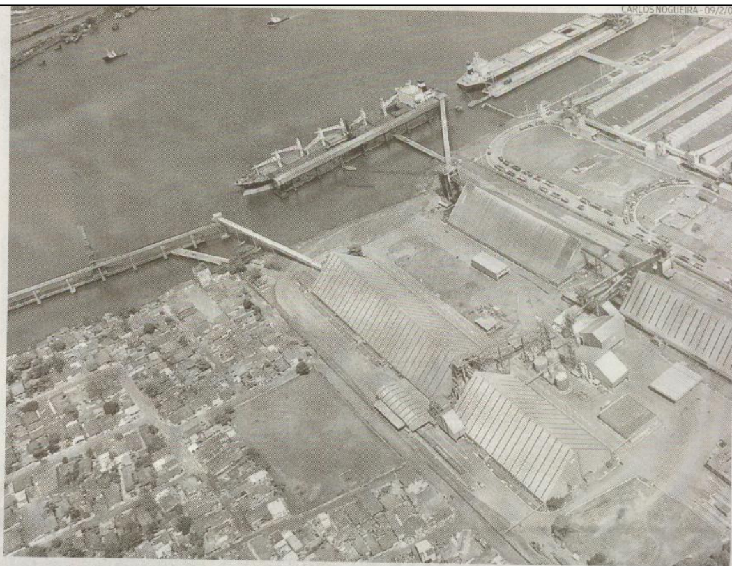
Futura arrendatária terá de investir R$ 13 milhões no terminal, de moegas a novo prédio administrativo

Os valores já mencionados são fixos e, portanto, não decidirão a vencedora da concorrência pública. O diretor da Companhia Docas explicou que a decisão sobre a vencedora recairá sobre o maior valor do item Oportunidade de Negócio, que também terá de ser