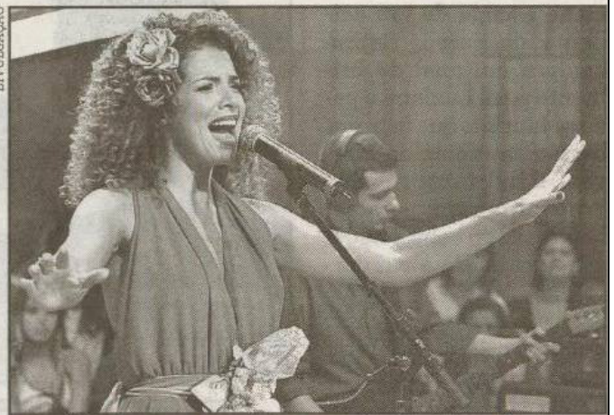
A cantora mostra músicas como Boa Sorte/Good Luck

23h, no Bar do Batata (Rua São Bento, 39, Centro de Santos). Informações pelos tels. 3219-2700 ou 7803-6696. Custa R$ 15,00 (eles) e R$ 10,00 (elas).