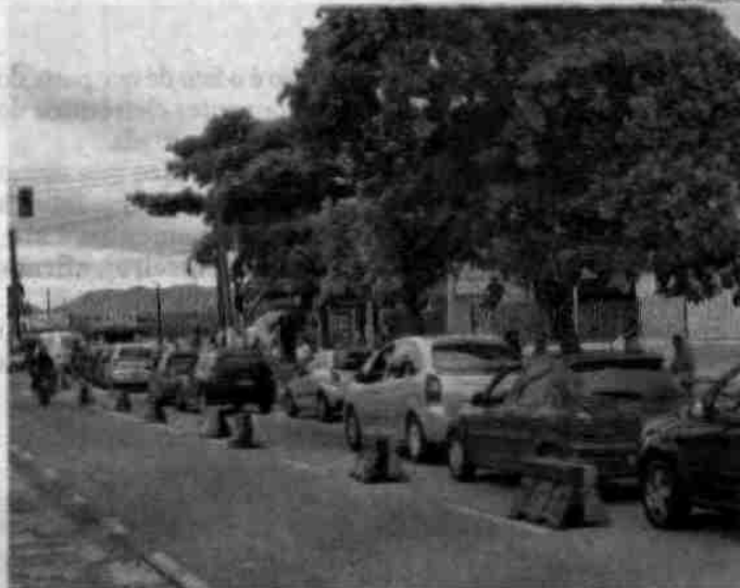
Usuários do serviço reagiram com indignação à atitude da Dersa

transtornos, representantes da Dersa se reúnem hoje com representantes da Polícia Militar e das prefeituras de Santos e Guarujá. O encontro será às 17h30 no batalhão da PM e visa a adoção de medidas conjuntas.