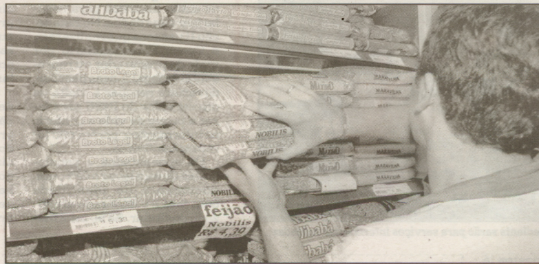
Na média do Município, valor da cesta composta por 31 itens foi de R$ 263,15 em abril

O custo da cesta básica no Centro e nos bairros próximos à orla de Guarujá é 4,75% maior do que no Distrito de Vicente de Carvalho. Esta é uma das conclusões do estudo desenvolvido mensalmente pela Unaerp Jr, empresa júnior mantida pela Unaerp Guarujá. De acordo com a pesquisa, o valor da cesta, composta por 31 itens alimentícios, higiene e lim-