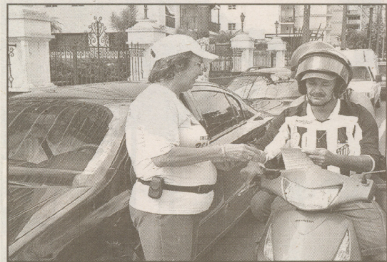
Na semana de combate à dengue, população está sendo alertada